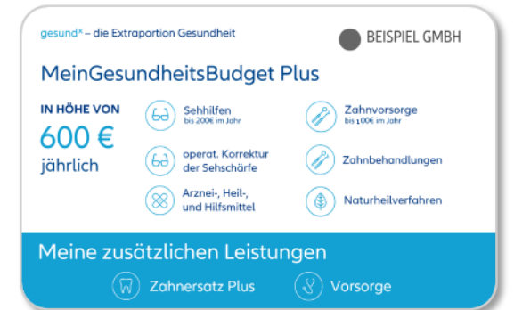
Muster MeinGesundheitsBudget Plus/Best und Kombimodell