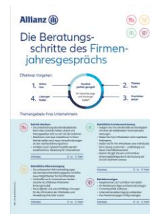
Einzel beschreibbare Module zum Jah- resgespräch (PDF) MM---0014Z0