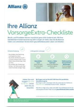
Checkliste VorsorgeExtra (PDF) MMK--0422Z0