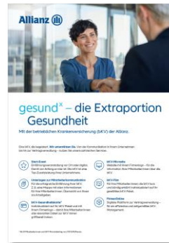
Servicebeileger Arbeitgeber MMK--0187Z0