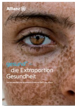
Verkaufsmappe Arbeitnehmer MMK--0040Z0