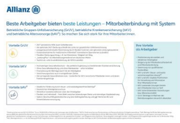
Beratungschart bUV(GrUV)/bAV/bKV MMS--7309Z0