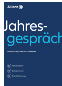
Jahresgesprächs- mappe MM---2014Z0