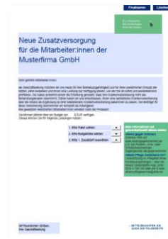
Individualisierbarer Gehaltsbeileger Budget/ Kombimodell