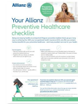
Preventive Healthcare Checklist (PDF) APKV-0611Z0