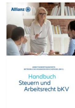
Handbuch Steuern und Arbeitsrecht bKV MMK--0046Z0