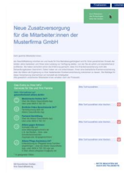
Individualisierbarer Gehaltsbeileger Bausteinmodell