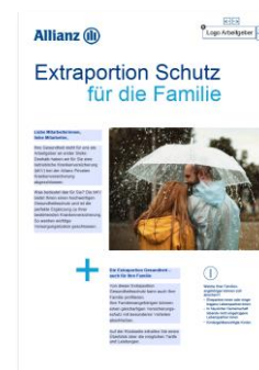
Flyer Familienabsicherung (editierbares PDF) MMK--0192Z0