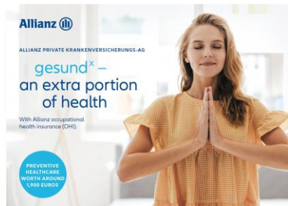
Preventive Healthcare Portfolio (PDF) MMK--0421Z0