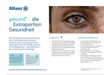
Verkaufschart (2-Pager) bKV MMK--0184Z0