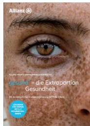
Flyer Klein- unternehmen (5-9 Mitar- beiter:innen) MMK--0100Z0