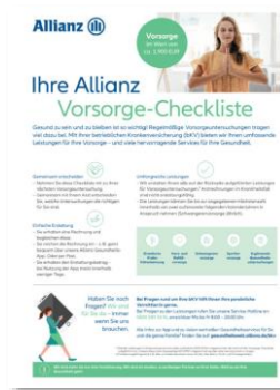
Checkliste Vorsorge (PDF) APKV-0021Z0