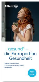
Serviceflyer für Arbeitnehmer MMK--0186Z0