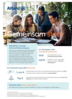
Verkaufschart (2-Pager) bAKS/bKV MMK--0285Z0