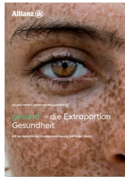
Verkaufsmappe Arbeitgeber MMK--0054Z0