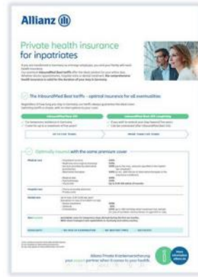
Produktsteckbrief Englisch APKV--220Z0 + neu: Produktsteckbrief inkl. KT APKV--xxxZ0