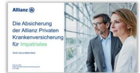
Einführungsfoliensatz Krankentagegeld Inbound