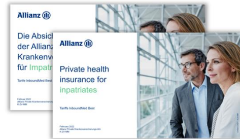
Basiskommunikation Deutsch und Englisch