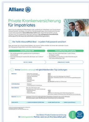
Produktsteckbrief MMK--0196Z0 + neu: Produktsteckbrief inkl. KT MMK--0204Z0