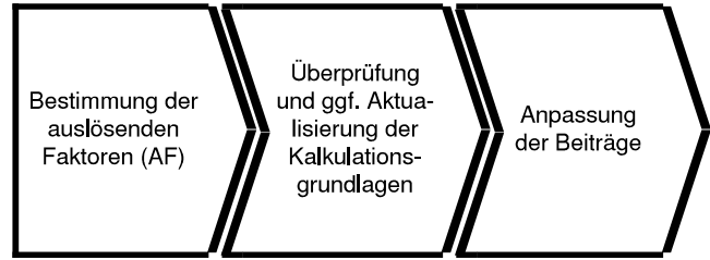
Vereinfachte, schematische Darstellung: Prozess der Beitragsanpassung

Die prozentuale Beitragsänderung jedes Einzelnen hängt zudem in starkem Maße von der Höhe des individuellen Beitrags ab. Ist zum Beispiel in einem Tarif für 55-jährige ein Mehrbeitrag von 50 Euro im Monat notwendig, um die zukünftigen Leistungen zu decken, dann steigt der Beitrag für 55-jährige Neukunden von beispielsweise 500 Euro auf 550 Euro. Dies entspricht einer prozentualen Erhöhung von 10%. Ist ein 55-jähriger Kunde in diesem Tarif dagegen schon sehr lange versichert und zahlt deshalb bislang nur 250 Euro, führt die gleiche absolute Erhöhung von 50 Euro zu einer prozentualen Steigerung von 20%.