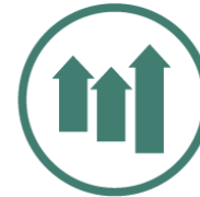
InvestFlex ohne Garantie