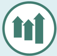
InvestFlex mit Garantie